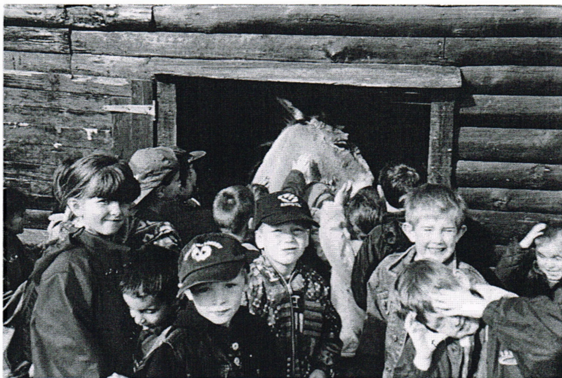
Les enfants nourrissent les animaux du centre